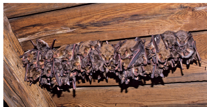
Grand murin Myotis myotis

* à l'exception des chiroptères, dont les sites de migration et/ou d'hivernage peuvent être désignés comme znieff