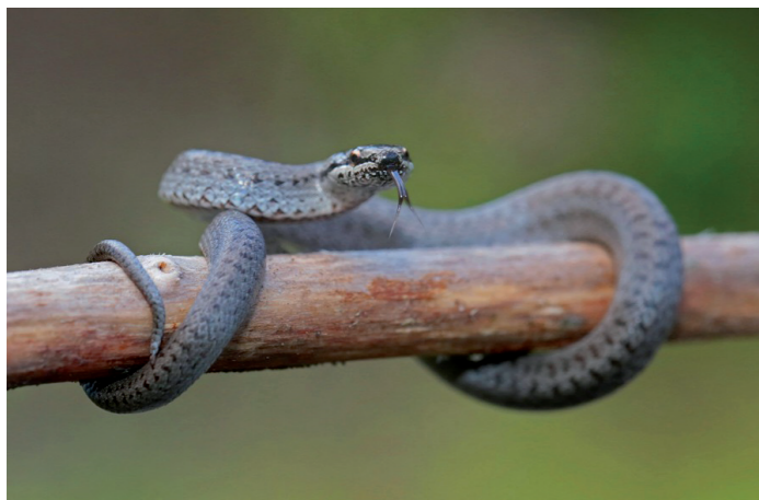
Coronelle lisse Coronella austriaca