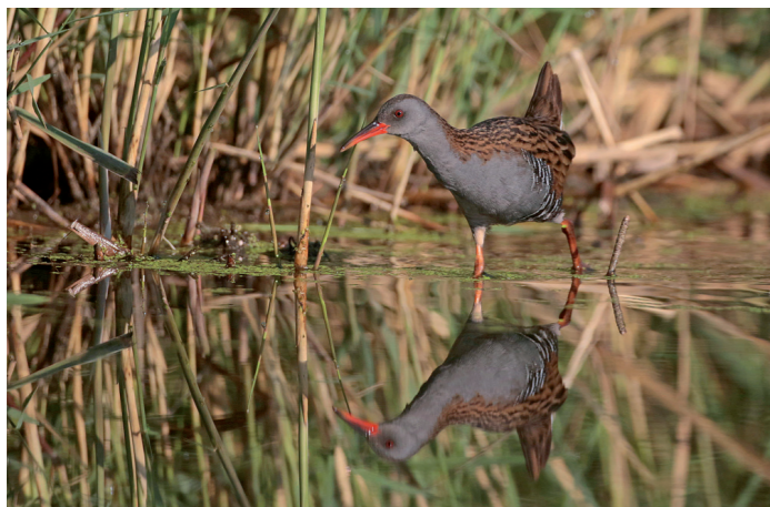
Râle d'eau Rallus aquaticus