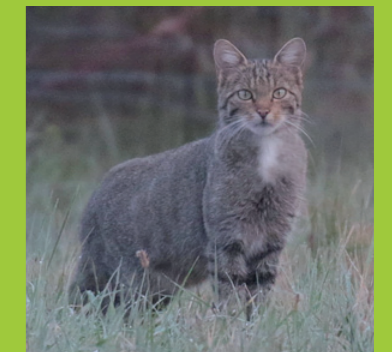
Chat forestier Felis sylvestris