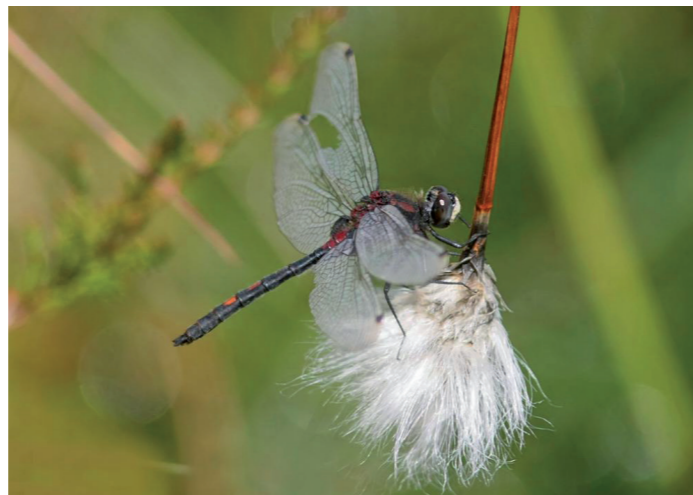
Leucorrhine douteuse Leucorhinia dubia