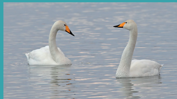
Cygne chanteur Cygnus cygnus