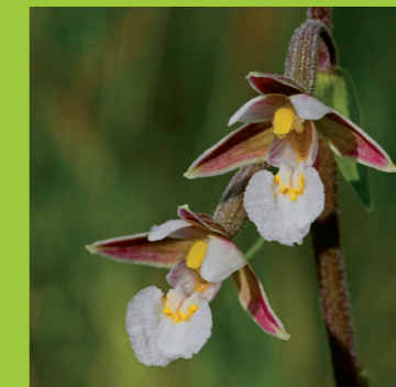
Epipactis des marais Epipactis palustris