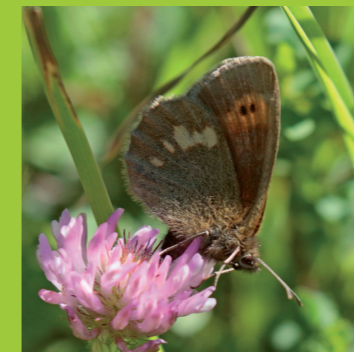
Moiré vosgien Erebia manto