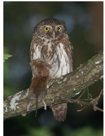
Chevêchette d'Europe - Yves Muller

En rejoignant le groupe de travail « Petites chouettes de montagne » : contact yves.muller@lpo.fr