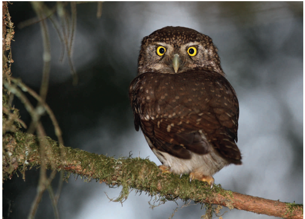
Chevêchette d'Europe - Yves Muller

Sa présence dans le massif vosgien est connue depuis la fin du XIX e siècle mais elle est restée rare et secrète jusqu'à la fin du siècle passé. Aussi, l'augmentation récente des populations vosgiennes au cours des deux dernières décennies mérite un coup de projecteur.